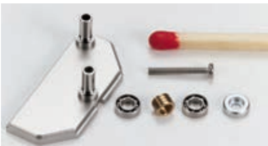
Das Foto zeigt den Edelstahlträger sowie den Teileaufwand für eine Seite. Achtung: Niemals selbst demontieren!

Der drehbar aufgehängte Träger aus Edelstahl (u.l.) ist ein feinmechanisches Kunstwerk. Er verfügt über extrem reibarme, hochpräzise Miniaturkugellager, die über eine Bronzefeder vorgespannt werden. Die Halteschrauben sitzen in winzigen verchromten Messingschalen.