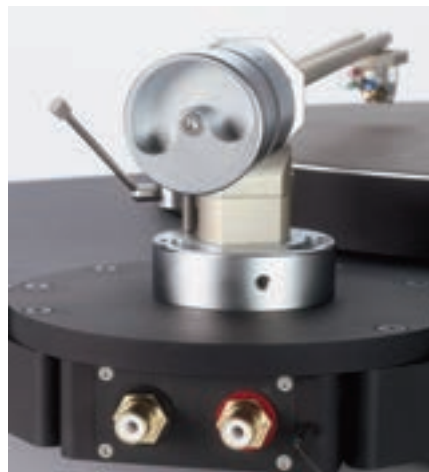
Exzentrisch belastetes Gegengewicht für unterschiedlich schwere Tonabnehmer, Cinch-Buchsen

Und das klappt: Die punktgenau gesetzte Energie bei gleichzeitiger Gelassenheit und Übersicht ist eines der markantesten Merkmale des TTT-C. Und nicht nur im Zusammenhang mit dem erstklassig klingenden EMT-System JSD 5 (um 2400 Euro), das beim Eintreffen in der Redaktion im Simplicity montiert war. Wohl kein Zufall, denn mit seiner erdigen, sonoren und dabei klaren, dynamischen Diktion passt das EMT absolut ins Klangkonzept des Drehers.