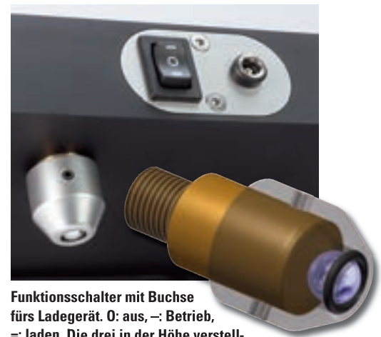
Funktionsschalter mit Buchse fürs Ladegerät. 0: aus, - : Betrieb, =: laden. Die drei in der Höhe verstellbaren Spikes stützen den TTT-C jeweils auf einer per Gummiring in Position gehaltenen Kugel ab