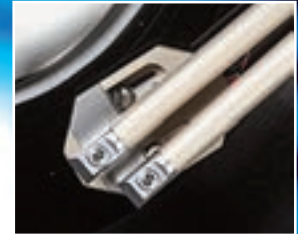
Beim Weg des Tonabnehmers über die Schallplatte verändert das Doppelgestänge des Simplicity dessen Kröpfung, also den Winkel zum Arm. Dieser ist am Außenrand der Platte (l.) größer und wird über deren Mitte (M.) bis zum Innenrand (r.) hin immer kleiner

ist kein Musikhören möglich. Das funktioniert nur per Akku. Sind die Batterien voll, sollte das beige packte, ganz leise vor sich hinzwitschernde Ladegerät vom Strom getrennt werden, da es sonst HF in die Anlage emittieren kann.