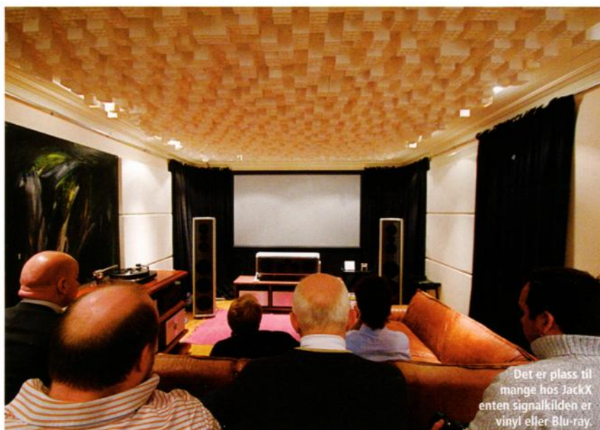
Det er plass til mange hos JackX, enten signalkilden er vinyl eller Blu-ray.

oppløsning og dynamikk. Holografien er også presis med fjellstø plassering og luft mellom artistene. Klangbalansen er nøytral og behagelig. Det finnes ingen påtagende sødme å spore og manges oppfatning av nøytral lyd som tynt og/eller hard passer overhode ikke inn i beskrivelsen her.