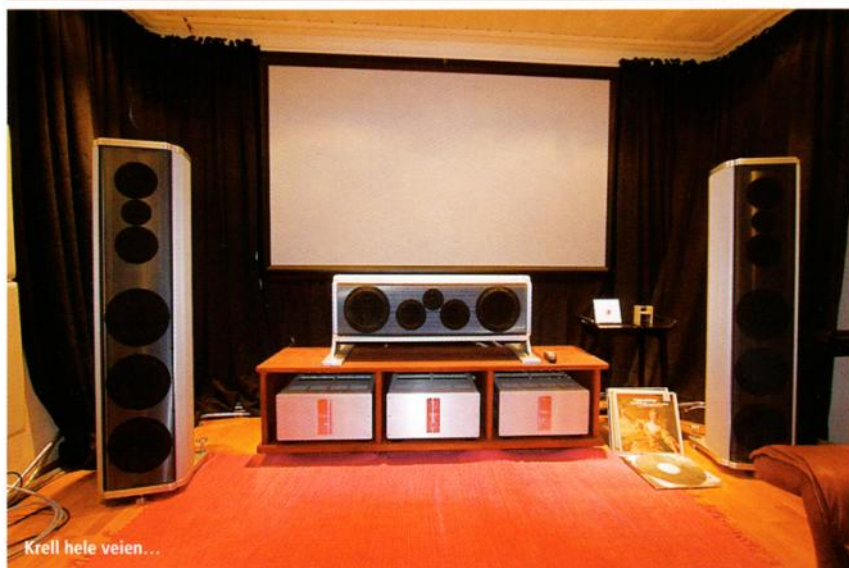
Krell hele veien...