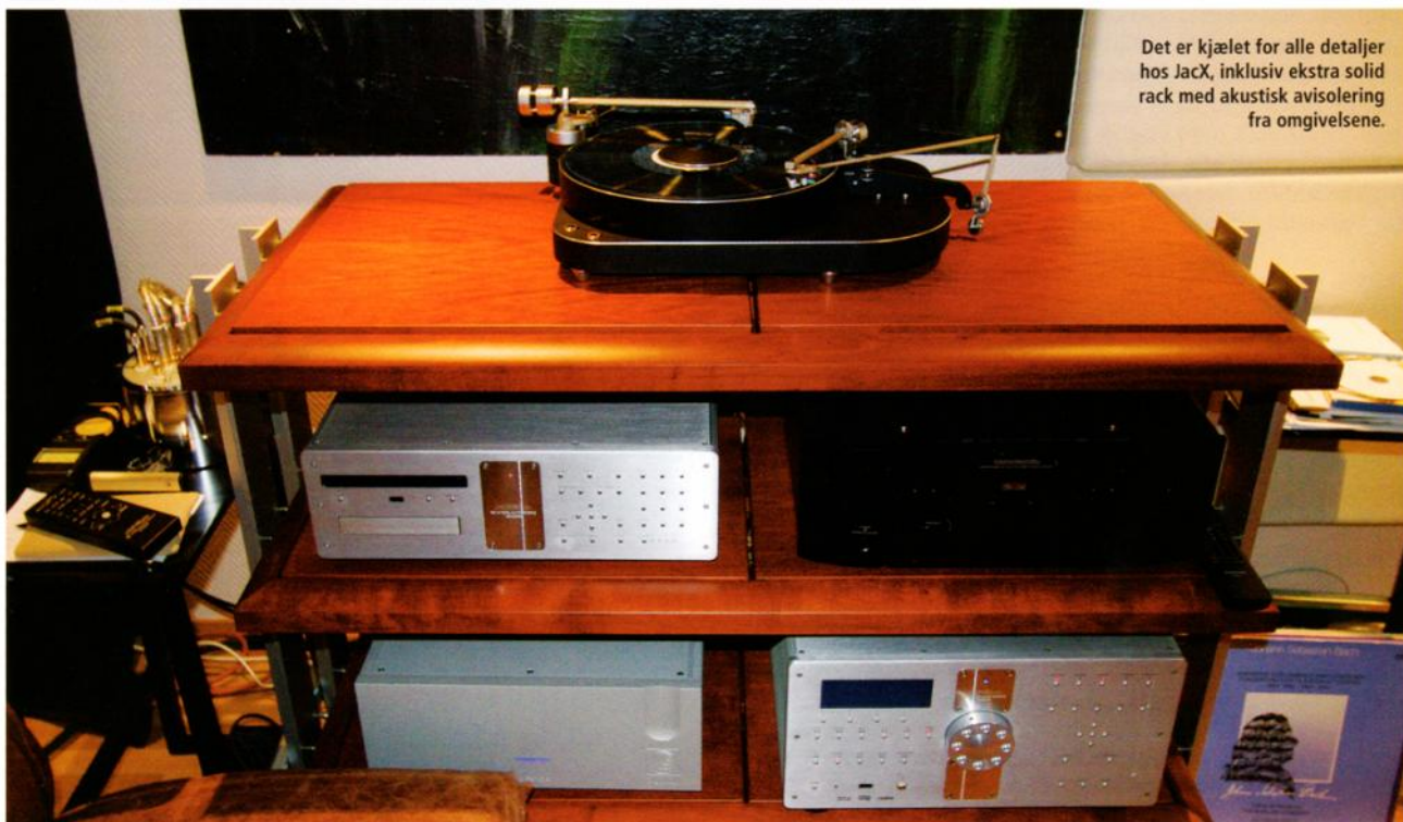
Det er kjælet for alle detaljer hos JackX, inklusiv ekstra solid rack med akustisk avisolering fra omgivelsene.