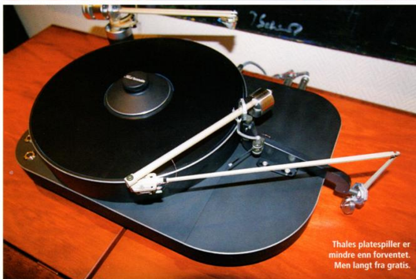
Thales platespiller er mindre enn forventet. Men langt fra gratis.

Når disse får noen hundre timers spilletid på seg og nye diffusorer er på plass bak fronthøytalerne, kan man bare drømme om hvordan dette vil spille. Det vil si, det er vel bare å sette seg ned, vente og håpe på å få komme tilbake... ☺