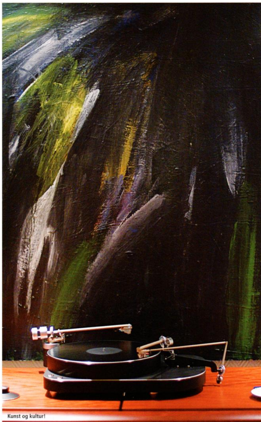
Kunst og kultur!

JackX har utført det mange mener er den ideelle fremgangsmåten for å opp- nå optimal lyd uten at man da nødven- diggvis behøver å kjøpe de dyreste kom- ponentene. Det ligger nok mye sannhet i det. Når man i tillegg, som JackX har gjort, tildeler store ressurser til kom- ponentene, blir resultatet som i dette tilfellet; enestående! Siden seansen var en presentasjon av Thales TTT og Simp- licity ble det naturlig nok kun spilt på vinyl. Så beskrivelsen av lyden er kun basert på vinylavspilling. Betydelig homogetet er det første som slår meg. Det er ikke noe som stikker seg ut av hverken imponatoreffekter eller nega- tive attributter. Lyden flyter sømløst og sammenhengende med stor presisjon,